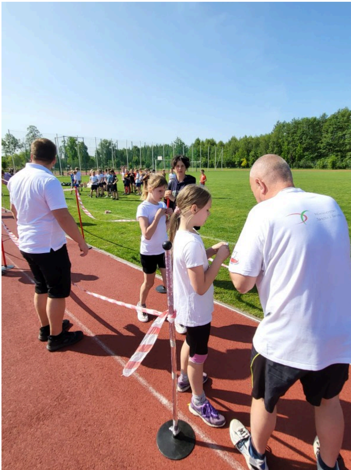
Wyścig kapsli na boisku szkolnym