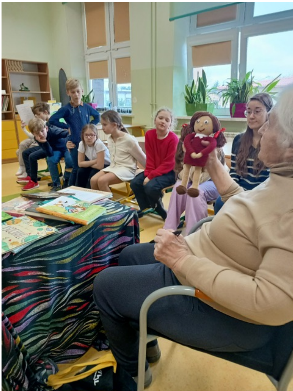
Czas na chwilę przerwy dla uczniów i ciasteczko w miłym towarzystwie.