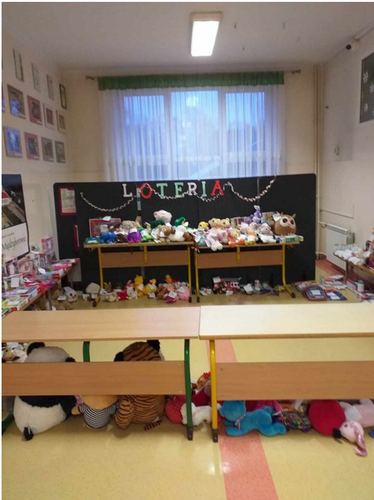
Szkolne koło TPD