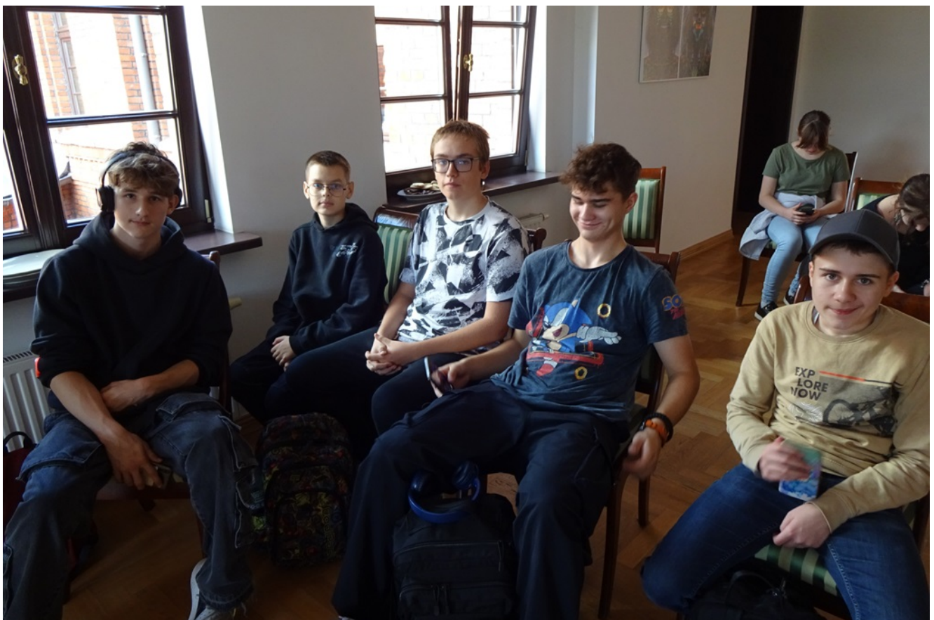
Po krótkim wykładzie, prezentacji przykładowych fotografii