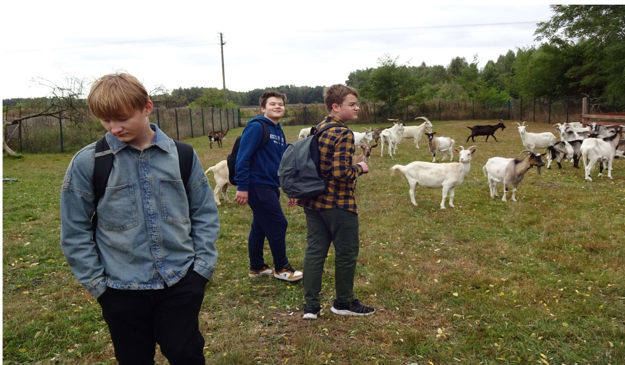
Odwiedziliśmy stadko kóz, z którymi również się zaprzyjaźniliśmy.