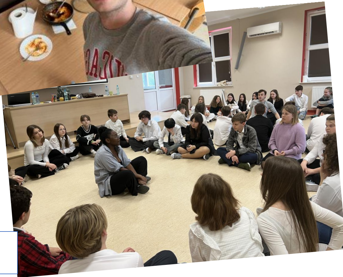
EUROWEEK W NASZEJ SZKOLE